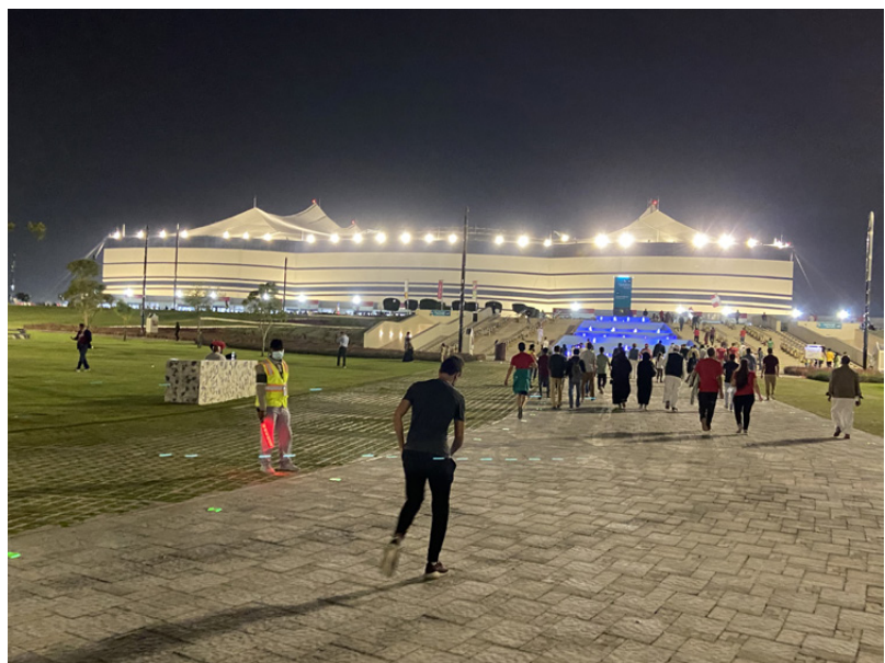
Al Bayt -stadion sijaitsee Al Khorissa, Dohasta 35 kilometriä pohjoiseen. Stadionilla pelataan muun muassa MM-kisojen avausottelu Qatar-Ecuador.

Ekologiset seikat on mainittu myös simpukan muotoisen, alueen helmensukelluksesta, kalastuksesta ja perinteisistä arabialaisista dhow-purjelaivoista inspiraationsa saaneen Al Janoub -stadionin kohdalla. Stadionin ympäristöön oli tehty jopa pyöriteitä, vaikka emme nähneet tutkimusmatkamme aikana kuin yhden pyöriilijän. Qatar on ensi sijassa yksityisautoja varten rakennettu maa. Qatar on sijaintinsa takia myös suuri elintarvikkeiden tuoja. Asetelmaa korostaa maan huonot välit naapurimaa Saudi-Arabiaan. Suurimpia kauppakumppaneita ovat viennin osalta Japani, Etelä-Korea, Intia, Kiina ja Singapore sekä tuonnin osalta Yhdysvallat, Ranska, Iso-Britannia, Kiina, Saksa ja Italia. Tavarat joudutaan kuljettamaan molempiin suuntiin meriteitse ja lentorahtina, joten maan hiilijalanjälki