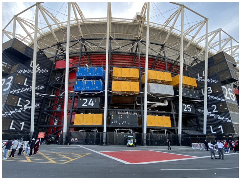
974-stadion eli niin kutsuttu konttistadion. Stadionilla pelataan seitsemän MM-kisaottelua.