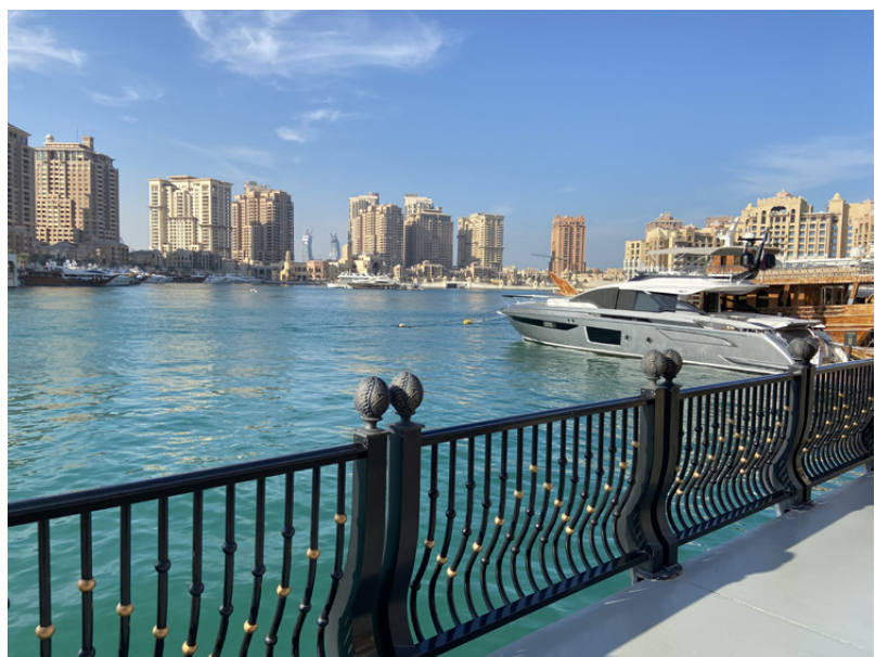
”Qatarin helmen” välimerelliseksi mainostettua aluetta Porto Arabiaa.

Huomionarvoista on, että viestejä uudenlaisesta Qatarista valvotaan tarkasti maan sisällä. Dohassa Smart city eli äly-