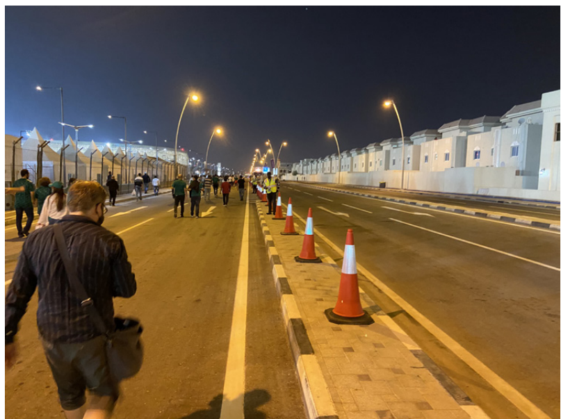
Kävelemässä ohjatulla reitillä kohti Al Thumama -stadionia. Vasemmalla stadionaluetta, oikealla tyhjiä asuinkeinteistöjä.