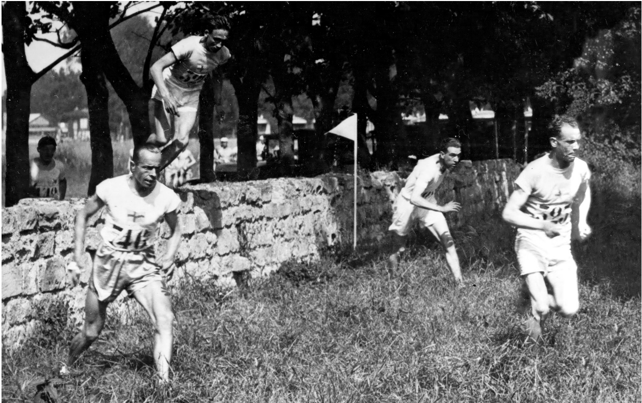
Paavo Nurmi johtaa Pariisin olympiakisojen maastojuoksukilpailua. Vasemmalla Ruotsin Edvin Wide ja aidan päällä Ville Ritola. Nurmi voitti ja Ritola oli toinen. Suomi oli joukkuekilpailun paras. Laji oli tuolloin viimeistä kertaa olympiaohjelmassa.