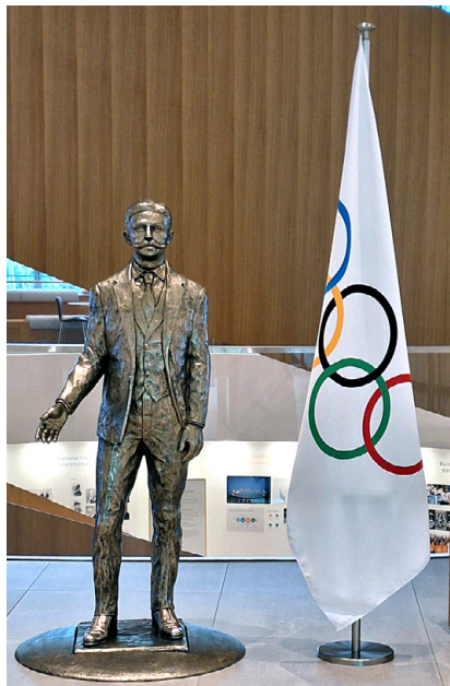
KOK:n ensimmäisen puheenjohtajan Pierre de Coubertinin patsas ja hänen suunnittelemansa olympialippu Lausannen olympiamuseossa.

Olympialaisissa kilpailuissa oli mukana tällä kertaa 22 kansakuntaa ja 1331 urheilijaa, joista toki 880 Ranskasta. Myös naiset oli hyväksytty mukaan ja brittiläisen 30-vuotiaan Charlotte Cooperin voitto tenniksessä oli ensimmäinen