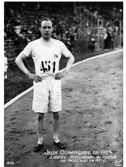
Eric Liddell Pariisin olympiakisoissa 1924.